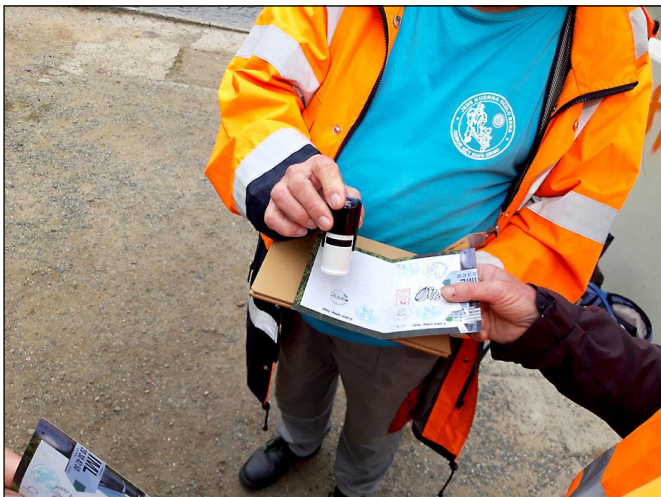
Během jednotlivých tras turisté sbírají razítka do startovního průkazu

Podrobnosti, kontakty a možnost se přihlásit předem naleznete na webu www.jedekudrnaokolobrna.com . Najdete tam i legendu o Žankovi Kudrnovi.