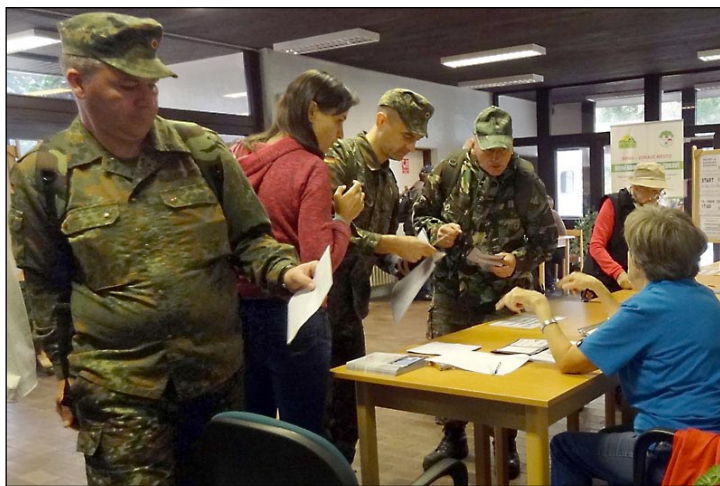
Skupina německých vojáků u prezence

Projít si severní část brněnského okolí tak přijíždějí nejen naši turisté, ale též početné skupiny hlavně z Evropy, ale výjimkou nejsou ani Japonci. Ve světě je zvykem, že na pochody jezdí organizované vojenské skupiny, například z NATO. Pro brněnský Bystrc je to významná záležitost, vždyť tolik cizinců najednou tu nikdo neviděl.